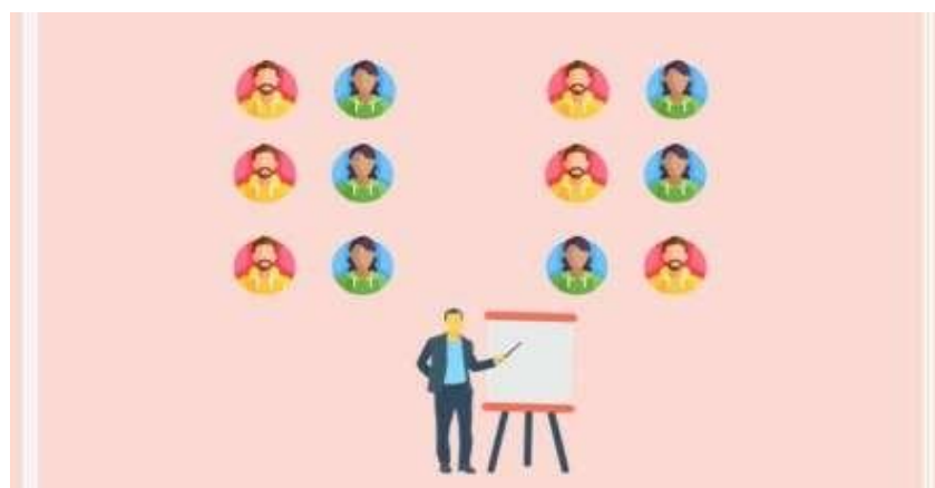
Contoh layout classroom