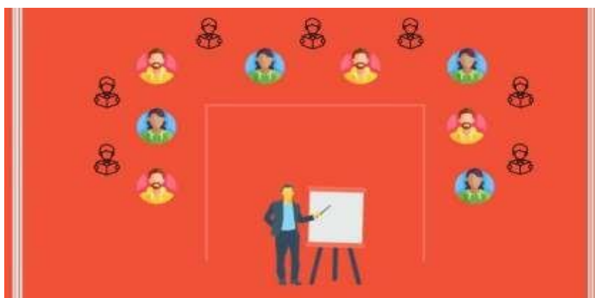
Contoh layout U-shape