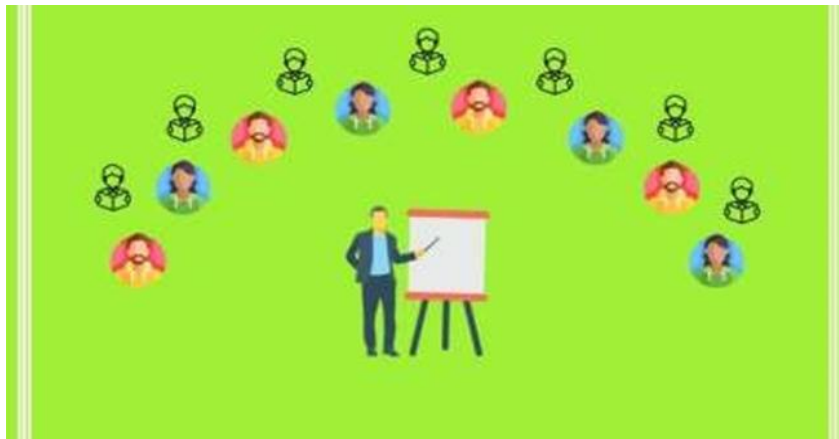
Contoh layout setengah lingkaran

Secara rinci, layout ruangan kelas sebagaimana digambarkan berikut ini: